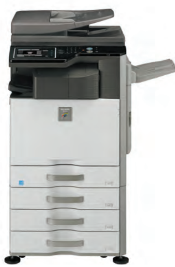
Unità Base Vassoio uscita superiore Finisher interno Stand con 3 cassette da 500 fogli